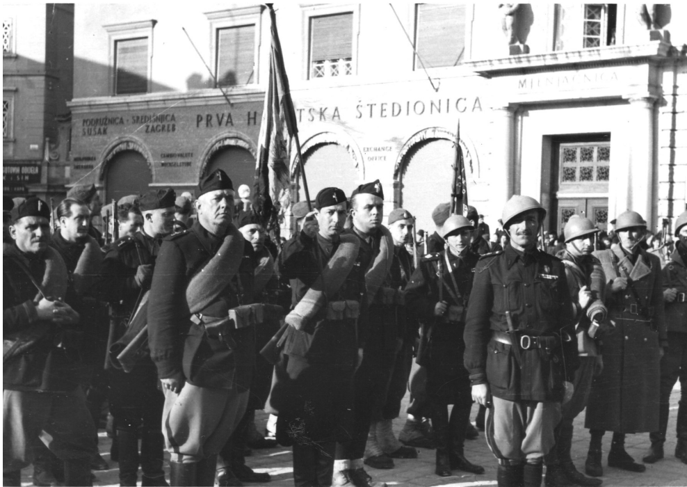
Sussak, 11 aprile 1941: Milizia MVSN e reparti dell'esercito italiano